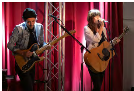
Belfour - Sémaphore en chanson - 09/11/2021

Vous les avez peut-être découverts en première partie de Benjamin Biolay, d'Emilie Loizeau, ou encore de Miossec, ils sont de retour sur la scène de Sémaphore pour jouer leur nouvel album !